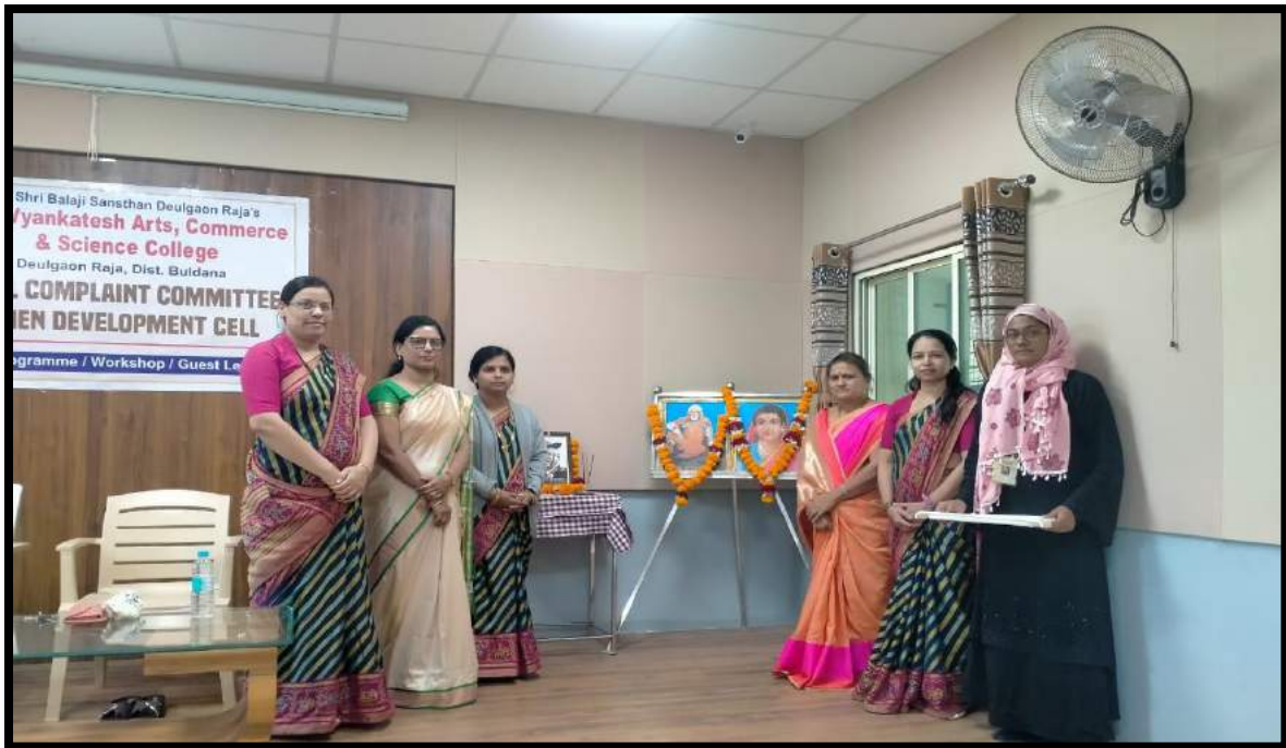
Induction Program For the girl students of the college