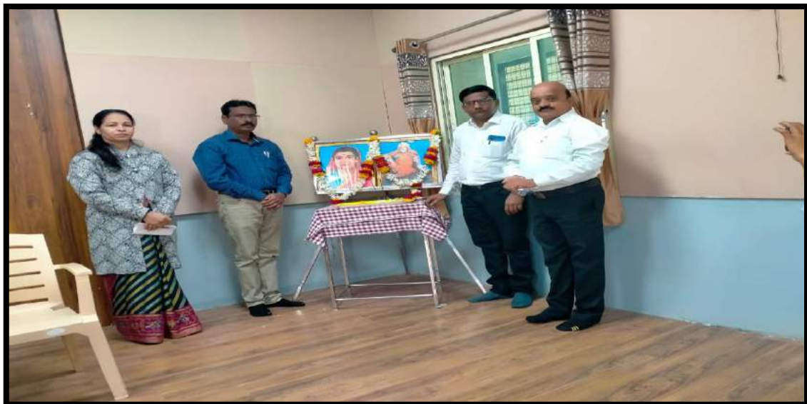
While worshipping the image of Savitribai Phule