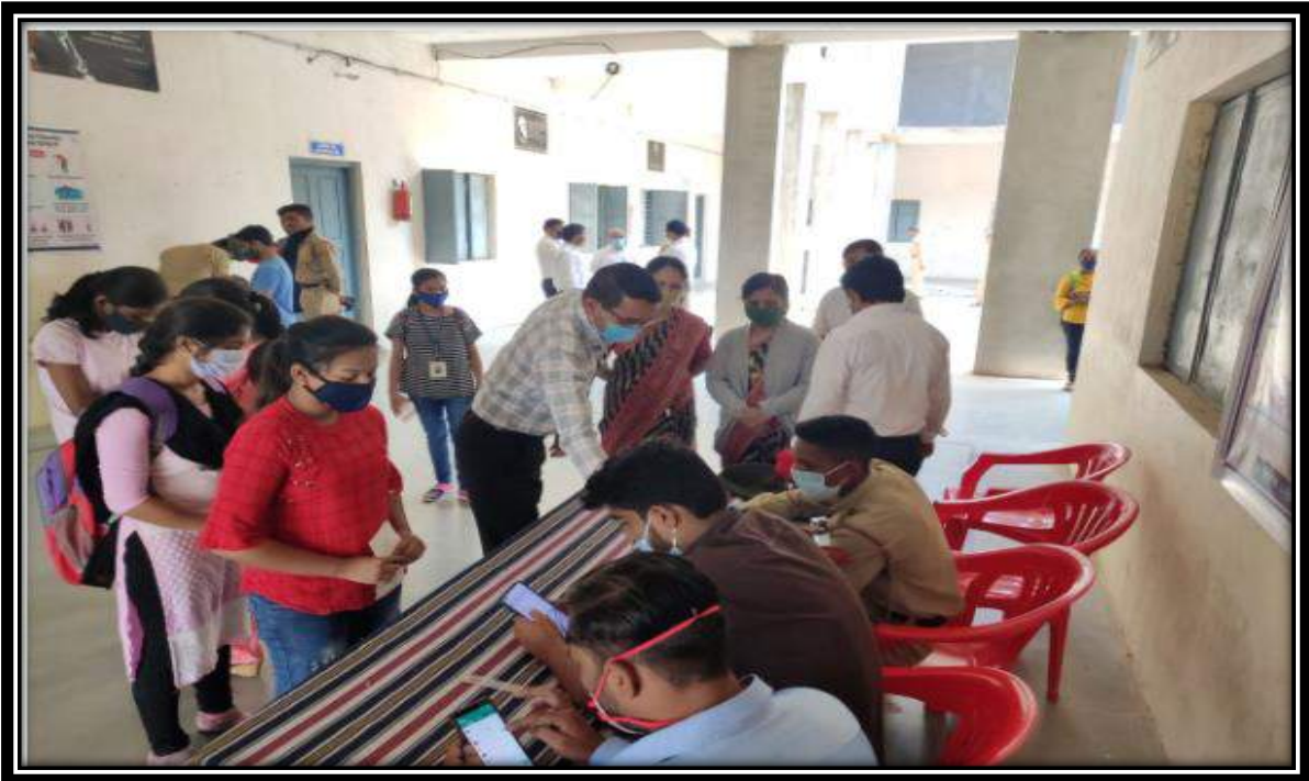
Registration of Girl students, Faculties, and Senior citizens for COVID-19 vaccinations