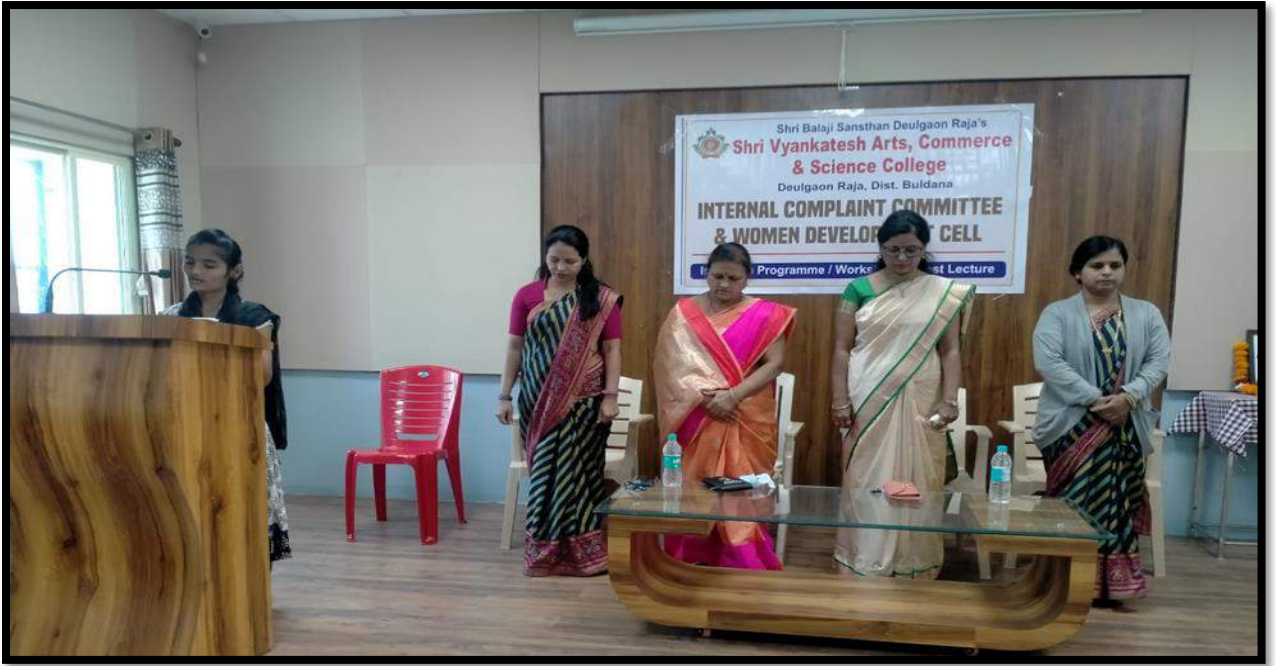
Paid tribute to General Bipin Rawat first chief of defense staff