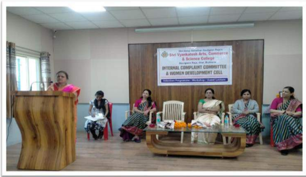
NGO, Member Hon. Sau, Malti Kayande madam while guiding girl students and other members of ICC & Women Development Cell