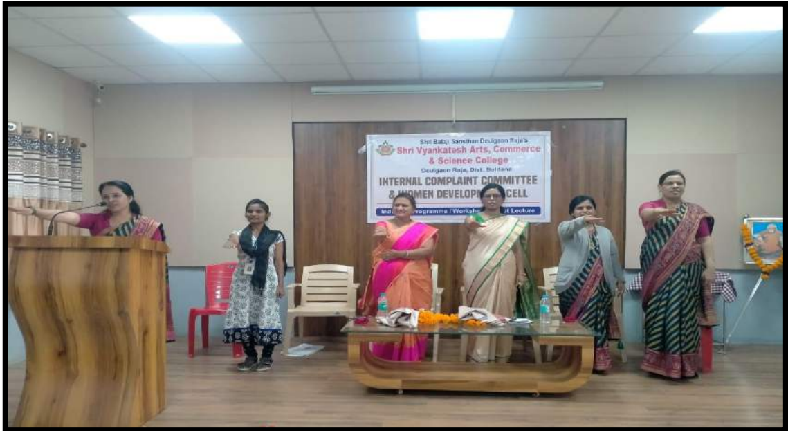
Students and Teachers took the oath of not quitting education