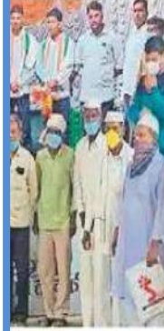
निदा व अन्य मान्यवर .