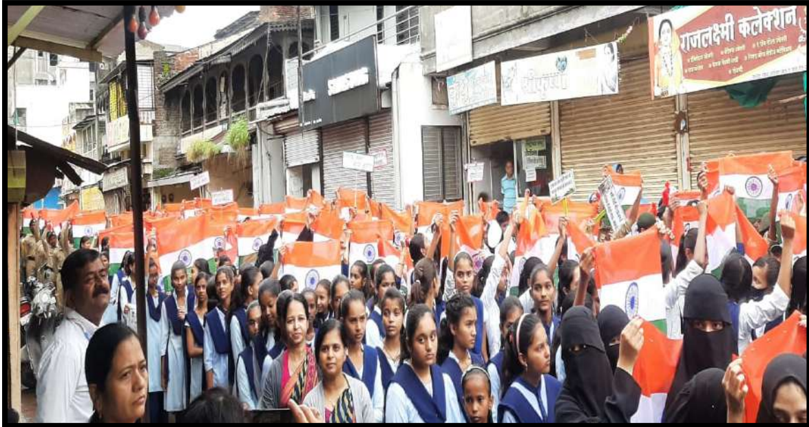
Participation of ICC & WDC Committee in 'Tiranga Rally' on the occasion of Azadi Ka Amrut Mohotsav