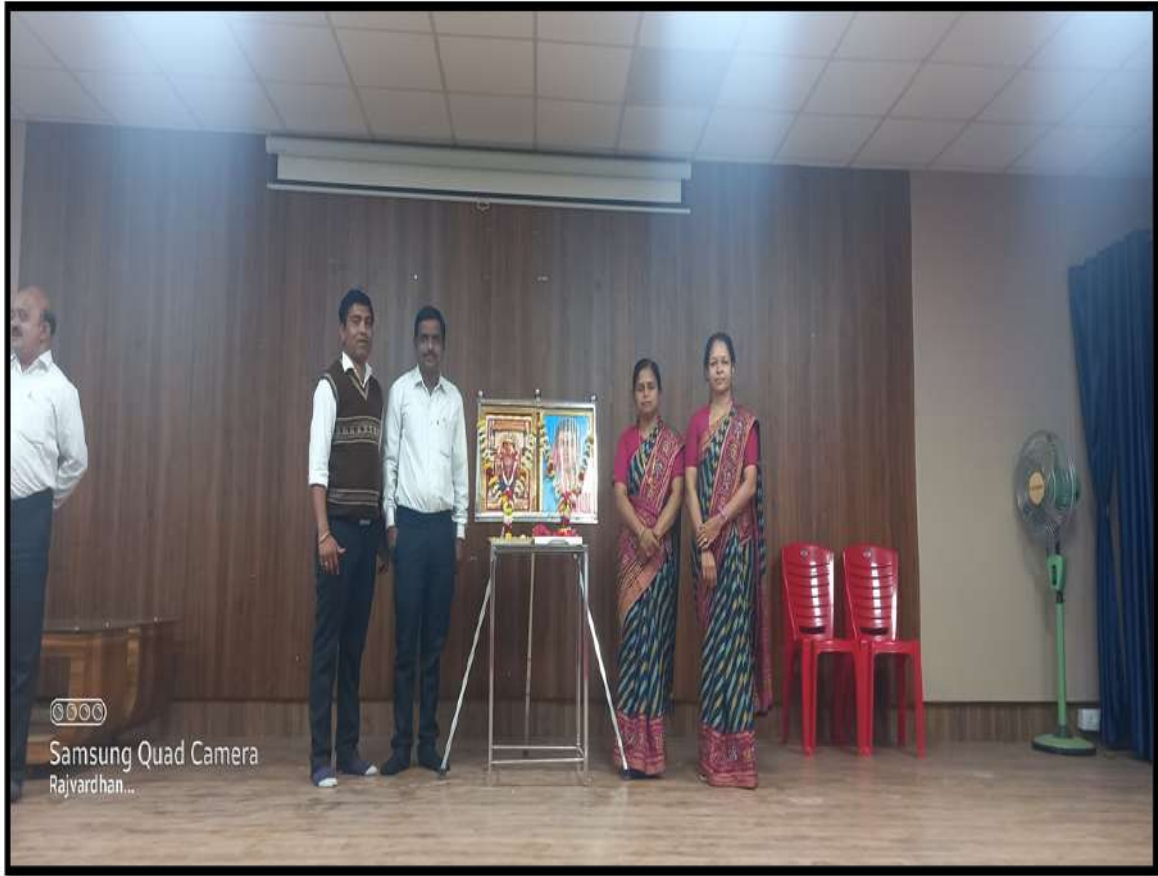
While offering wreath and salutations on the occasion of birth anniversary of Savitribai Phule