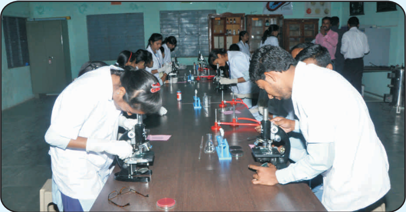
विज्ञान विद्याशाखेतील प्रयोगशाळा