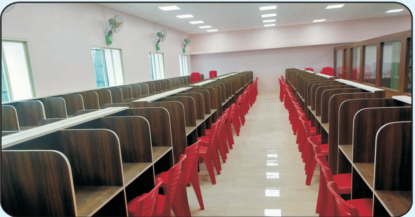
ग्रंथालयातील विद्यार्थ्यांसाठीचा वाचन कक्ष