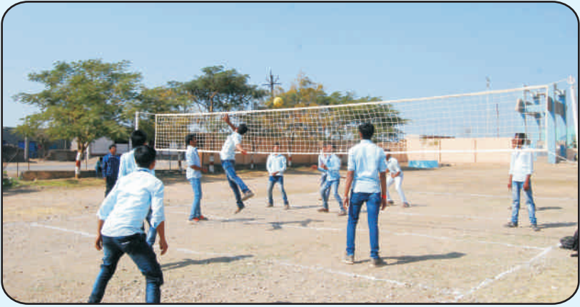
मैदानी खेळांची सुविधा