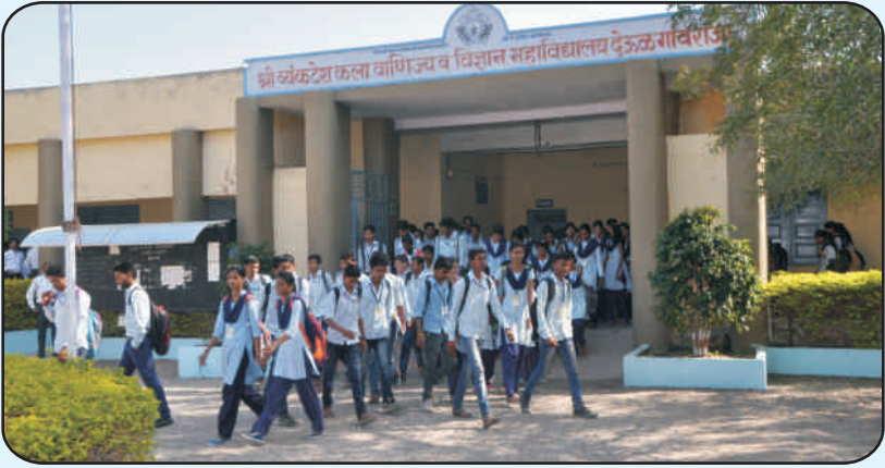
कला व वाणिज्य विद्याशाखेची इमारत