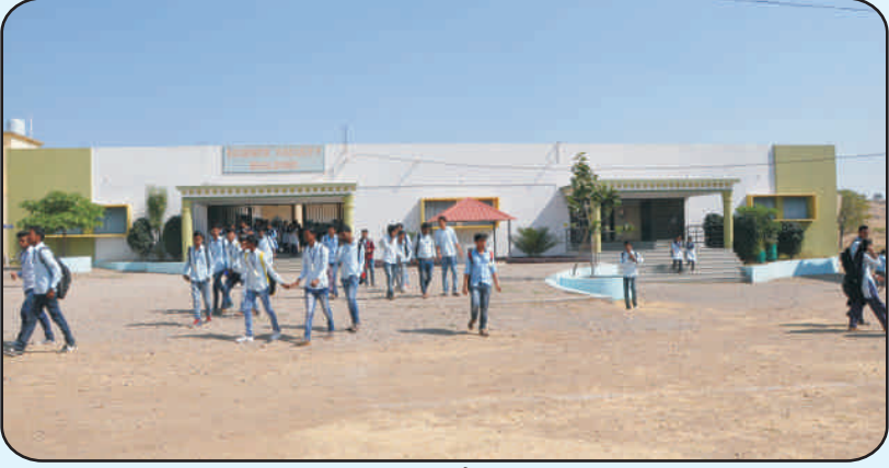
विज्ञान विद्याशाखेची इमारत