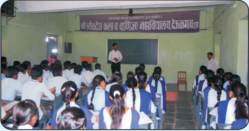
महाविद्यालयातील तासिका कक्ष