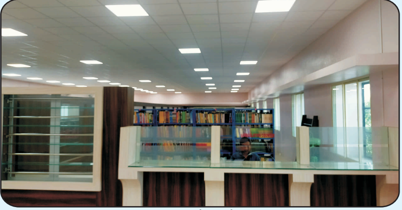
ग्रंथालयातील ग्रंथ देवाण-घेवाण कक्ष